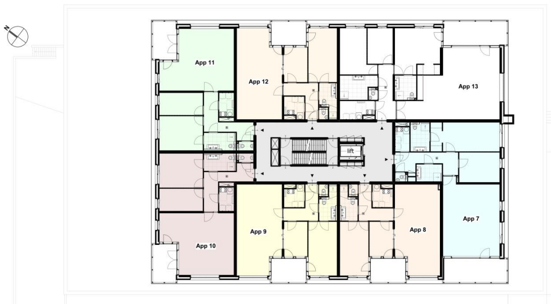
1 e verdieping Appartement 7 t/m 13