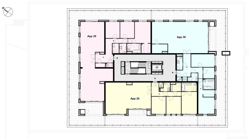
4 e verdieping Appartement 28 t/m 30